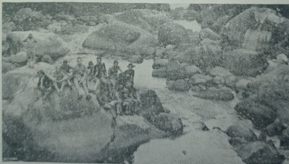
Os escoteiros juniores e seniores da Associação «Alcindo Guanabara», da Light, da Região do Distrito Federal, estiveram acampados no Parque Nacional Itatiaia. O flagrante acima foi apanhado durante a excursão ao Lago Azul.