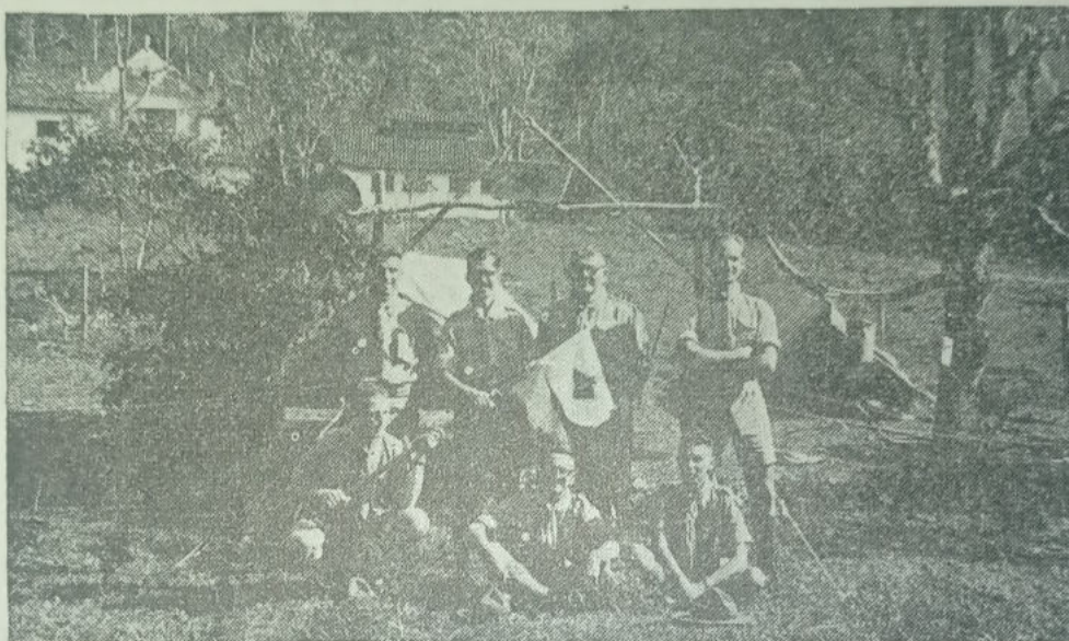
A Patrulha dos «Guarás» em pose especial para esta Revista, após o encerramento do curso.

Dir-lhe-ei apenas: faça o curso. Não é difícil, nem fácil. Muito menos "coisa para inglês ver". Como método, é condicionamento do temperamento e caráter individuais à vida escoteira; como processo, é ação de patrulha num bom trabalho e numa feliz aventura.