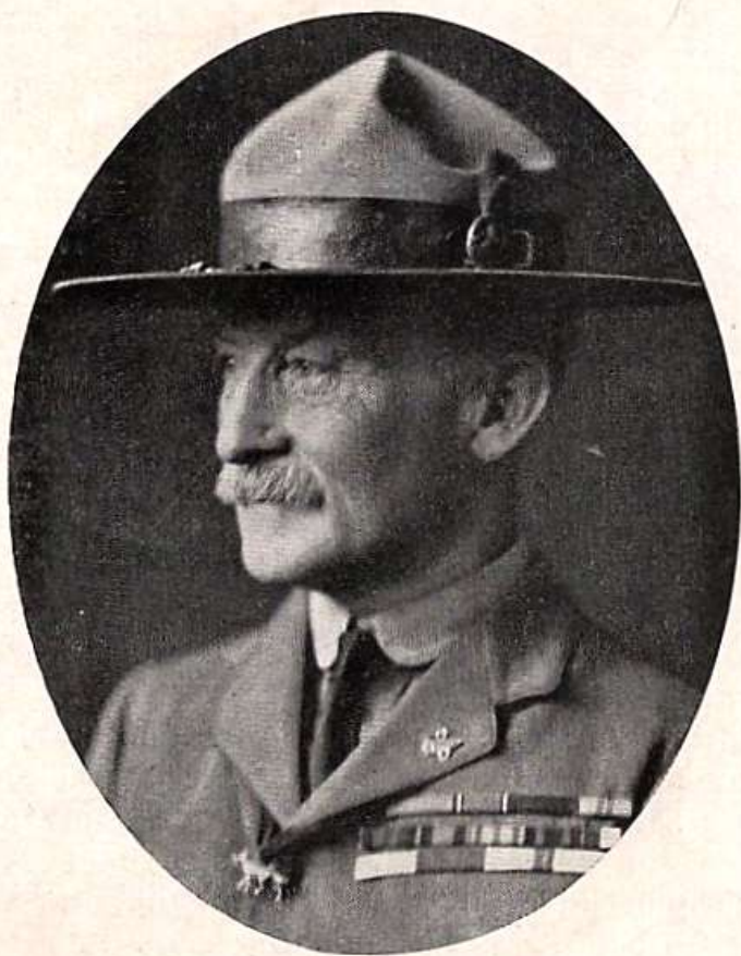
Robert Baden Powell